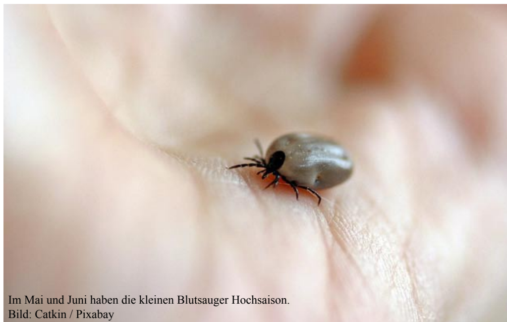
Im Mai und Juni haben die kleinen Blutsauger Hochsaison.

Nach dem Aufenthalt im Wald, Unterholz und auf Wiesen sollte die Haut nach Zecken abgesucht werden. Besonders häufig stechen Zecken in die Kniekehlen, Leisten und Achselhöhlen. Generell wird im Wald das Tragen von gut abschliessenden hellen Kleidern empfohlen. Auf hellem Hintergrund sind Zecken besser zu erkennen und können sofort entfernt werden, bevor sie auf die Haut gelangen. Ebenfalls von Vorteil ist ein Zeckenschutzmittel für Haut und Kleider.