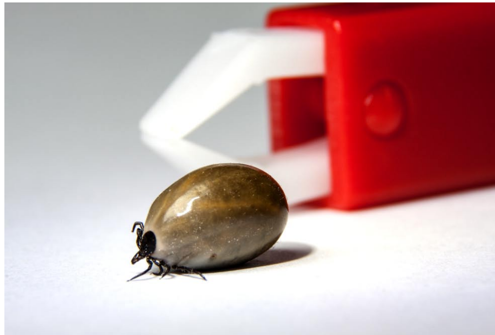
Zecken können mit einer Pinzette oder einer Zeckenzange entfernt werden.