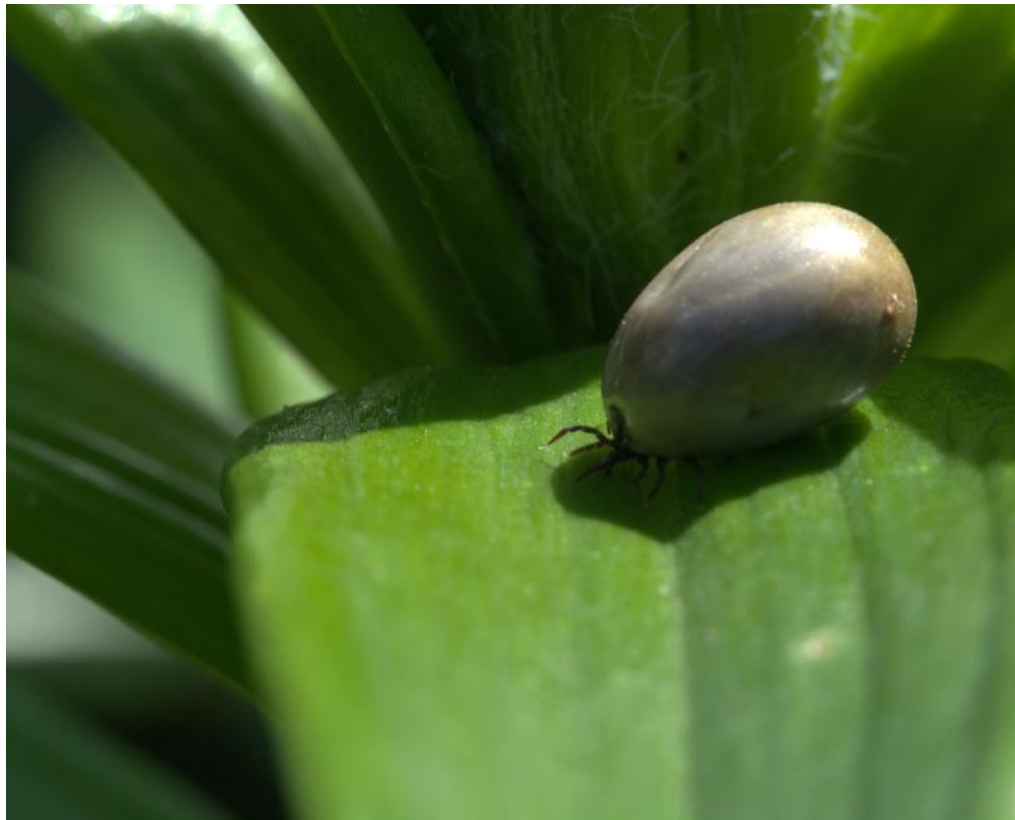
Zecken können Viren und Bakterien übertragen.

Das Gesetz umschreibt den Unfallbegriff als plötzliche, nicht beabsichtigte schädigende Einwirkung eines ungewöhnlichen äusseren Faktors auf den menschlichen Körper. Ein Zeckenstich erfüllt die verlangten Kriterien und wird deshalb von den Unfallversicherern als Unfall eingestuft (Hautverletzung mit Infektionsrisiko). Die Kosten werden somit durch den Unfallversicherer getragen.