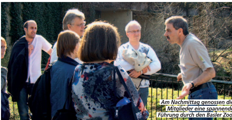
Am Nachmittag genossen die Mitglieder eine spannende Führung durch den Basler Zoo.