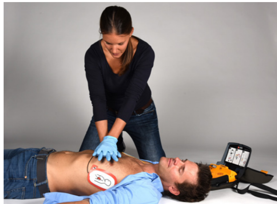
Reanimation: Der Systemansatz tritt bei der aktuellen Überarbeitung deutlicher in den Vordergrund.

Neuerungen gibt es unter anderem deshalb so wenige, weil die Maxime nun darin besteht, nur zu ändern, was zu ändern sich wissenschaftlich seriös argumentieren lässt. Gegenüber früheren Detailbetrachtungen tritt 2015 der Systemansatz deutlicher in den Vordergrund.